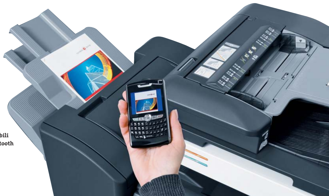
Stampa da dispositivi mobili tramite connessione bluetooth opzionale