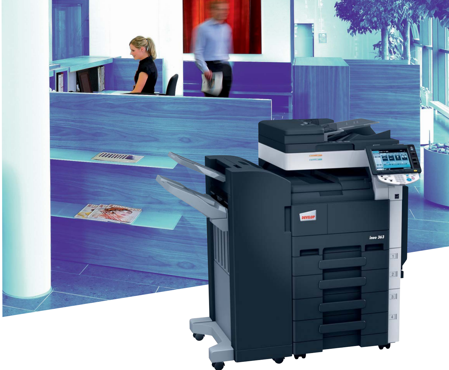
ineo 363 con finisher a pavimento (FS-527) e cassetto carta (PC-208)