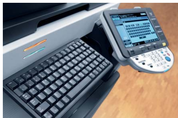
Display touch screen a colori e tastiera opzionale di ineo 363

Una squadra perfetta. I sistemi ineo 363/423 offrono grandi vantaggi per tutte le attività di stampa e copiatura in bianco e nero; i sistemi ineo+ a colori garantiscono invece una stampa a colori professionale: una combinazione conveniente per la produzione di documenti aziendali di alta qualità.