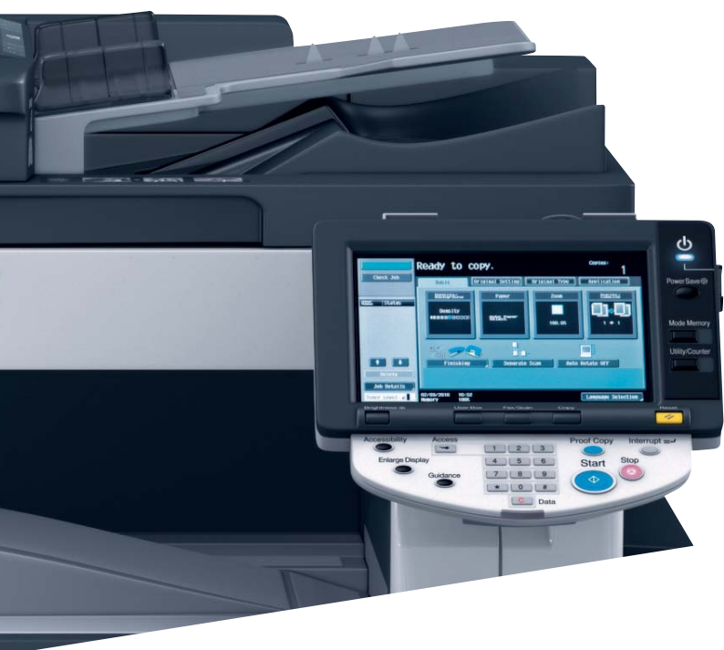
Display touch screen a colori di ineo 363, semplice da utilizzare

L'elevata qualità di stampa, unita a una vasta gamma di funzioni di finitura, consente la stampa interna di documenti aziendali professionali, come per esempio brochure. Se si aggiungono anche le funzioni di bucatatura e pinzatura, la produttività dell'ufficio sarà ancora maggiore.